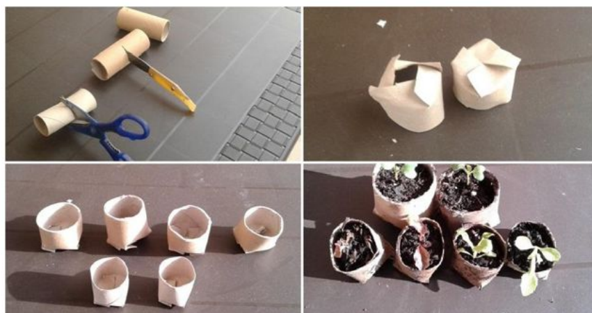
Figura 1.6. Semilleros con rollos de papel higiénico