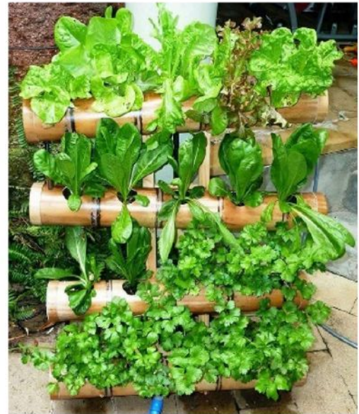
Figura 1.3. Imagen equilibrio entre estética vs. productividad

En una producción comercial, para la mayoría de hortalizas, el agricultor o productor inicia el ciclo de producción desde la semilla, pasando luego al almácigo y culmina con la planta, y aunque en nuestros hogares podemos sembrar siguiendo ese patrón, tal vez no sea lo más conveniente. El señor Páez nos da un ejemplo que es muy claro para entender este punto.