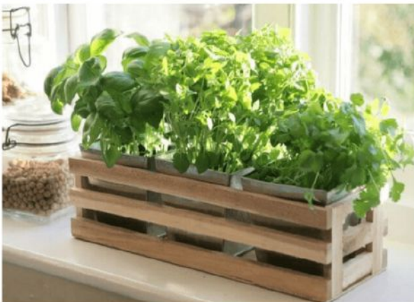
Figura 1.1. Imagen de huerta en espacio reducido