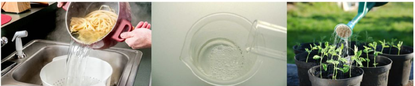
Figura 1.7. Nutrición de las plantas utilizando los caldos de cocina

Toda esta información y consejos nos ayudan, no sólo a conocer más sobre el mundo de las huertas caseras, sino también a animarnos a sembrar en casa, porque como se dice en el ámbito de la agricultura, no importa que tan urbana llegue a ser nuestra vida siempre ocuparemos y querremos saber de agricultura.